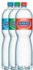
Henneiz Blau, Grün & Rot 6 x 150 cl